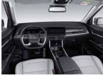
라이트 그레이(Light Gray) 인테리어