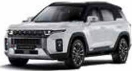
그랜드 화이트 (WAA)