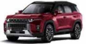
체리 레드 (RAV)

* 1Tone : 루프 / 스포일러 : 바디 컬러, C필러 : 실버 컬러 * 2Tone : 루프 / 스포일러 / C필러 : 블랙 컬러(LAE) * 2Tone 선택 시 세이프티 선루프 선택 불가