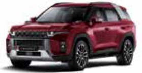
체리 레드 (RAV)