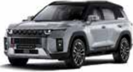
아이언 메탈 (ADE)