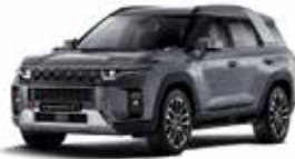
플래티넘 그레이 (ADA)