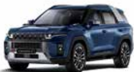
맨디 블루 (BAS)