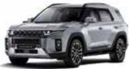
아이언 메탈 (ADE)