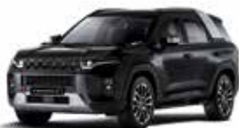
스페이스 블랙 (LAK)