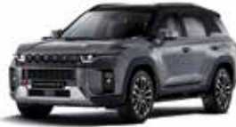
플래티넘 그레이 (ADA)