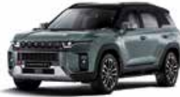
포레스트 그린 (GAO)