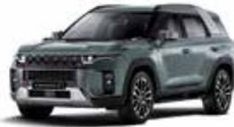
포레스트 그린 (GAO)