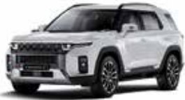
그랜드 화이트 (WAA)