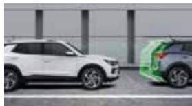
앞차 출발 경고 FVSW