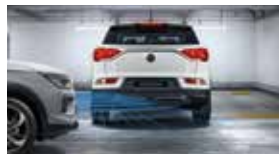
후측방 접근 충돌 보조 RCTA