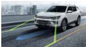
중앙 차선 유지 보조 CLKA