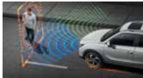
긴급 제동 보조 AEB