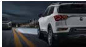
스마트 하이빔 SHB