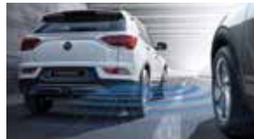
후측방 경고 BSW