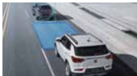
안전 거리 경고 SDW