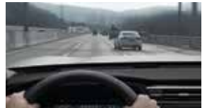
고속도로 및 고속화도로 안전 속도 제어 SSA