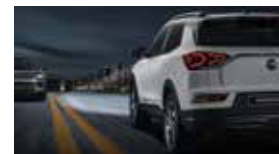
스마트 하이빔 SHB