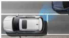
안전 하차 경고 SEW

카메라와 레이더를 통해 주변 상황을 완벽하게 스캐닝하고 차량을 안전하게 제어해 주는 최첨단 자율주행 시스템입니다.