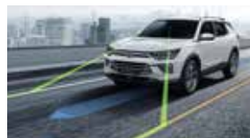
중앙 차선 유지 보조 CLKA