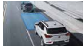
안전 거리 경고 SDW