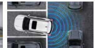
후측방 접근 경고 RCTW