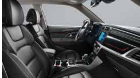
차콜 블랙 인테리어(그레이 헤드라이닝)