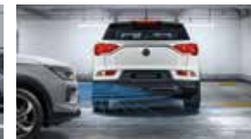
후측방 접근 충돌 보조 RCTA