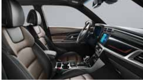
에스프레소 브라운 인테리어(블랙 헤드라이닝)