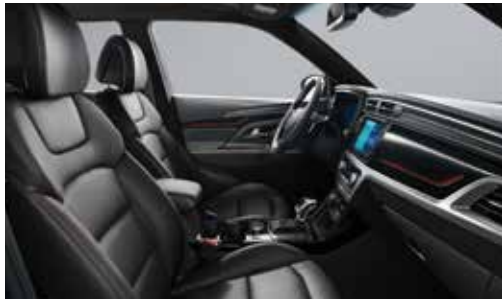
R-PLUS 전용 인테리어(블랙 헤드라이닝)