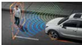
긴급 제동 보조 AEB