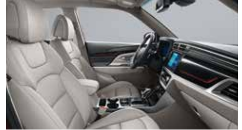
소프트 그레이 인테리어(그레이 헤드라이닝)