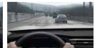
고속도로 및 고속화도로 안전 속도 제어 SSA