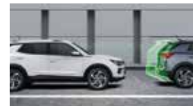
앞차 출발 경고 FVSW