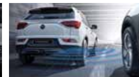
후측방 경고 BSW