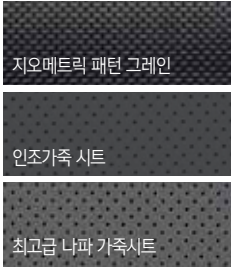
지오메트릭 패턴 그레이인