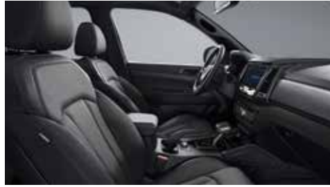
블랙 인테리어(블랙 헤드라이닝)