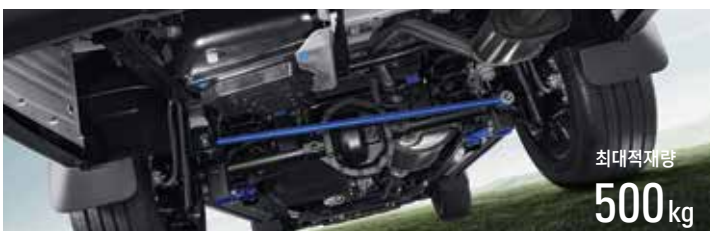
5링크 서스펜션 최대 500kg까지 적재가능하며 부드러운 승차감으로 레저 라이프를 즐길 수 있습니다.