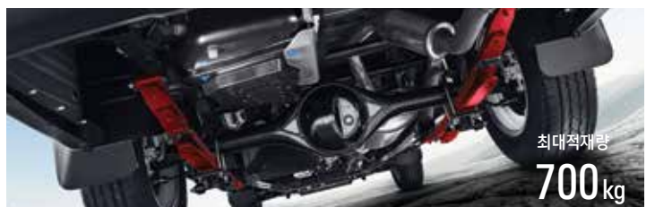
파워 리프트 서스펜션 최대 700kg까지 적재가능하며 전문적인 장비를 활용한 폭넓은 레저 라이프를 즐길 수 있습니다.