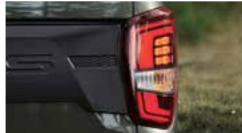
LED 리어 콤비램프