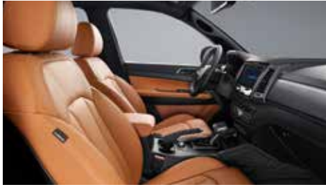
브라운 인테리어(블랙 헤드라이닝)