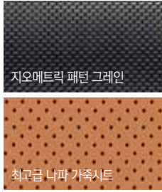
지오메트릭 패턴 그레이인