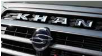
뉴 디자인 라디에이터 그릴